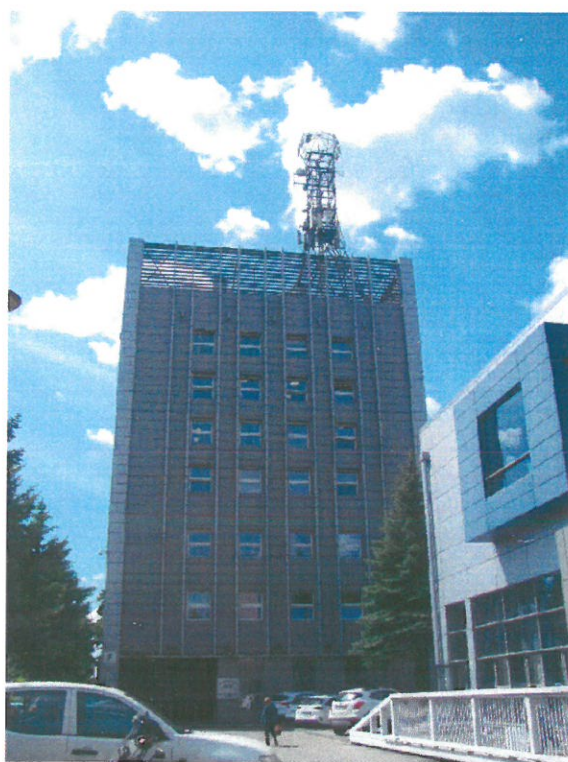
Zat. nr 1: Widok ogólny instalacji radiokomunikacyjnej.